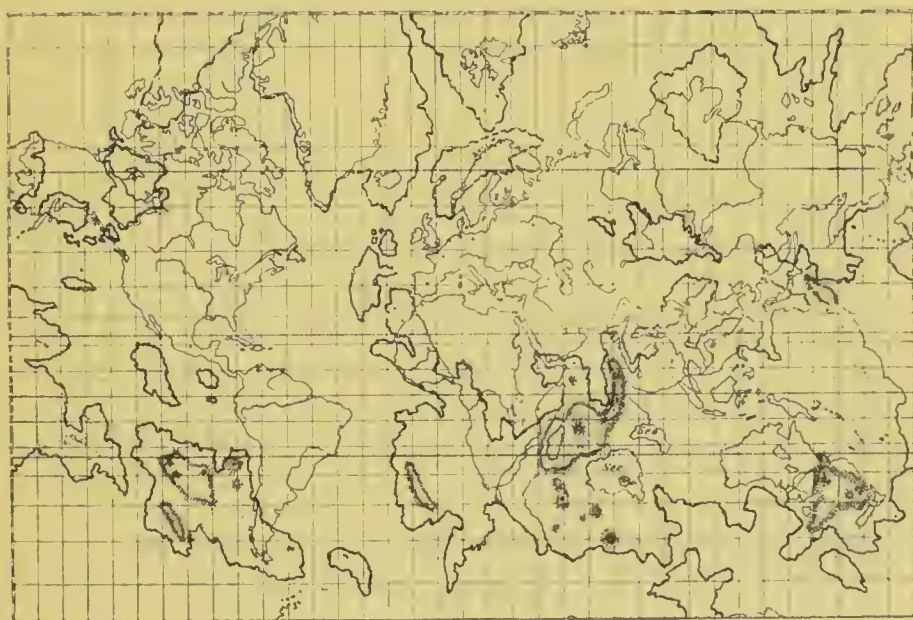
No. 5. Lemuria in seiner grössten Ausdehnung nach Scott-Elliot.

Die starken Linien geben die lemurische, die schwachen die heutige Landverteilung an.