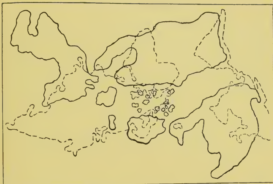
No. 4. Die Kontinente zur Jurazeit. (Nach Neumayr).