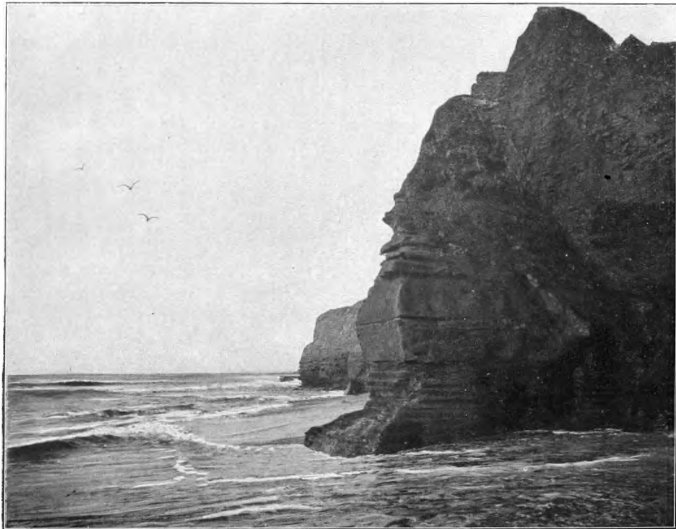
FELSGESTADE VON POINT LOMA AM STILLEN OZEAN