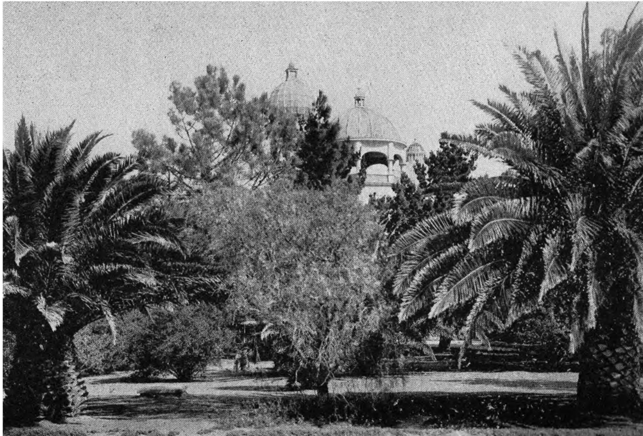
EINIGE DER GÄRTEN IN DER UMGEBUNG DER RAJA YOGA-AKADEMIE AM INTERNATIONALEN THEOSOPHISCHEN HAUPTQUARTIER, POINT LOMA