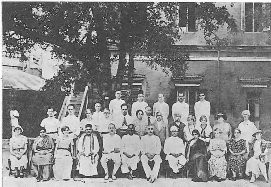
ČLANOVI VIJEĆA JUBILEJSKE SKUPŠTINE U ADYARU 1935 PRIGODOM ŠEZDESETE OBLJETNICE TEOZOFSKOGA DRUŠTVA