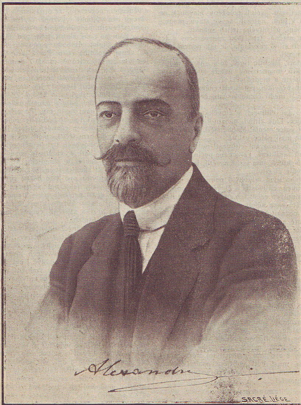
Ruský velkokníže Alexander.

Viděli, jak klouby ztuhlé a srostlé od narození a nehybné, po 3 týdnech dostávají hybnost, že bývalý chorý — mrzák — klidně chodí, viděti ochrnutí 5 let trvající vracející se k normální funkci údů ve 4 týdnech, musí naplniti pozorovatele i pacienta údivem,