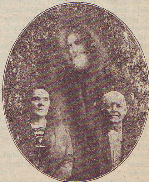
Psychická fotografie Dra. Youngera.

Doktor Younger býval nadšeným hlasatelem lé-čení pomocí rostlin a stoupecem magnetické, elek-trické a vodní léčby. Odvtlil se (zemřel) již před dvaceti lety.