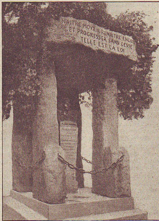
Hrob Allana Kardeka na hřbitově Pére-Lachaise v Paříži.