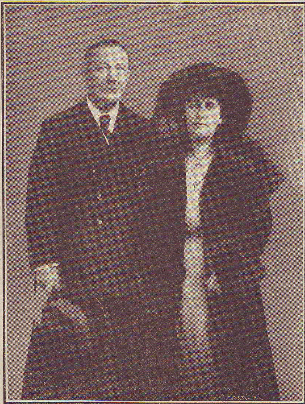
Sir Arthur a lady Conan Doyle.