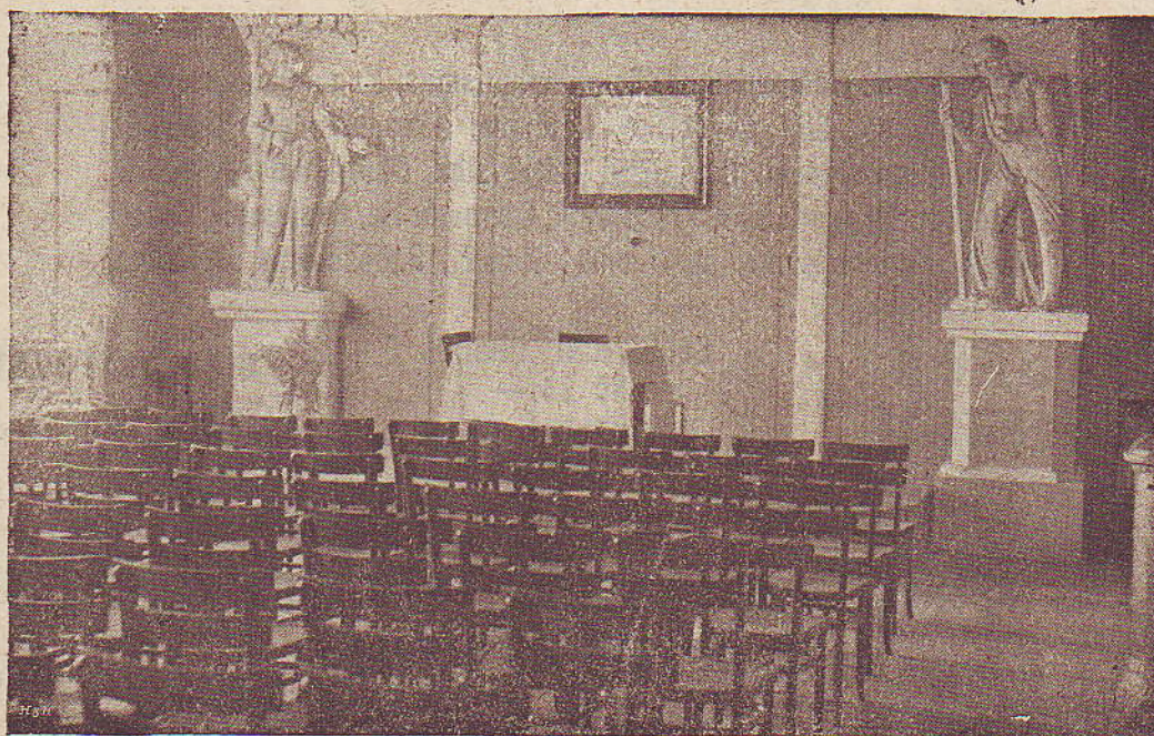
Průčelí sálu ve spolkovém domě „Bratrství“ v Radvanicích ve Slezsku.

V záležitostech spolkových nutno adresovati přímo: Spiritistický spolek „Bratrství“ v Radvanicích ve Slezsku.