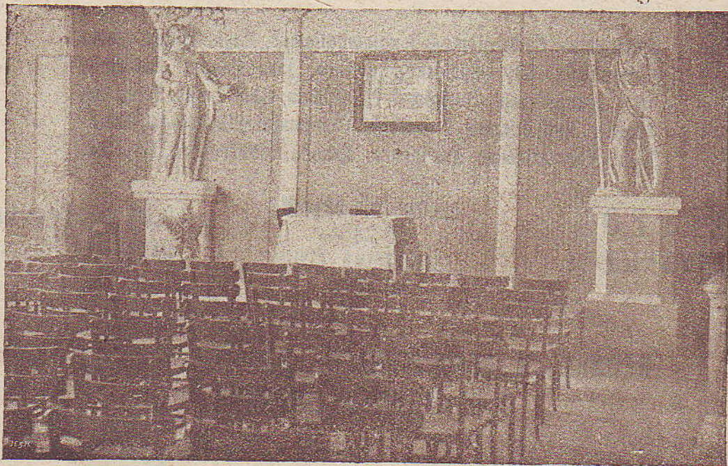
Průčelí sálu ve spolkovém domě „Bratrství“ v Radvanicích ve Slezsku.

V záležitostech spolkových nutno adresovati přímo: Spiritistický spolek „Bratrství“ v Radvanicích ve Slezsku.