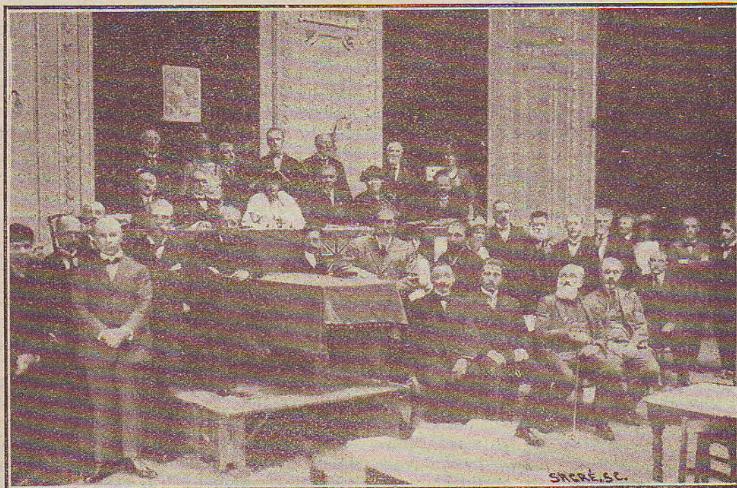
Mezinárodní kongres spiritistických delegátů v Liege v Belgii, konaný v srpnu 1923 v staroslavném paláci «Mean». (Viz článek na str. 131 ve IV. ročníku Spirit. revue).

Nevědomost lidská jest veliká a ona jest také matkou těch nejrůznějších omylů a křivd.