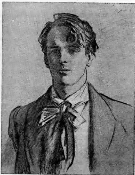
Τζών Σ. Σάρτζεντ Ούιλ Μπ. Γέητς ΕΚΑΤΟ ΧΡΟΝΙΑ ΑΠΟ ΤΗ ΓΕΝΝΗΣΗ ΤΟΥ ΓΕΗΤΣ ΟΥΪΛΛΙΑΜ ΜΠΑΤΛΕΡ ΓΕΗΤΣ (1865-1939)

Ἐδῶ κ' ἑκατό χρόνια, στὶς 13 Ἰουνίου τοῦ 1865, γεννήθηκε ἓνας ἀπὸ τοὺς μεγαλύτερους καὶ τοὺς πιὸ πρωτότυπους ἀγγλόφωνους λογοτέχνες τῆς ἐποχῆς μας, ὁ ἱρλανδὸς Ὀυΐλλιαμ Μπάτλερ Γέητς (William Butler Yeats), ποιητῆς, πεζογράφος καὶ δραματογράφος.