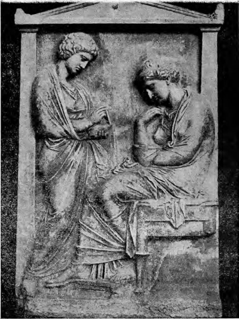
Ἐπιτύμβια στήλη τῆς Ἥγησῶς, τῆς κόρης τοῦ Προξένου. Ἐθνικὸ Ἀρχαιολογικὸ Μουσεῖο, Ἀθήνα