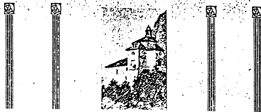
2. Die Grottenkapelle in Montserrat.