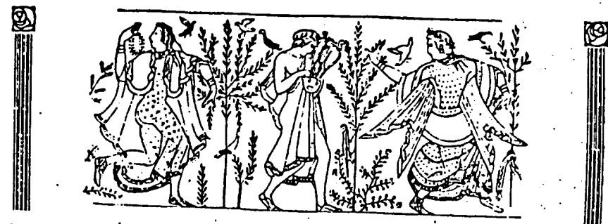
Abb. 2. Zeit der beginnenden Kleiderkultur und Weiberkultur, darstellend ein altetruskisches Wandgemälde. Das Profil der linken Tänzerin deutet auf mittelländischen Einschlag hin, die Etrüster waren ein herold mediterranes Mischvolk von großer Sinnlichkeit. Gerade dieses Gemälde zeigt besonders deutlich, daß die Kleidung ursprünglich nicht protastische Notwendigkeit, sondern nur Körperverschmuck zur Steigerung der Erotik war. Denn die Gewebe sind durchsichtig und lassen die Körper der Tänzerinnen, die den Mann sofort umschwärmen (Kennzeichen der Weiberkultur), nur zu deutlich sehen.

Standbilder verehrt. Von einem sonderbaren Gebrauch, der offenbar auf eine ausgebildete Nacktkultur zurückgeht, erzählt Tacitus. 1 Jünglinge führen nackt Schwertkänge auf, nicht aus Absichten des Gewinnes oder Erwerbes, sondern lediglich zu ihrem eigenen Vergnügen, um ihre Körper geschmeidig zu machen, die Körperbewegung zu veredeln und den Zuschauern einen Augenschmaus zu bereiten. 2 Nackt zogen die alten Dorier in den Kampf (vgl. Abb. 1), halb nackt, wegen des rauhen Klimas, rückten die alten Germanen in die Schlacht aus (vgl. „Ostara“, Nr. 63, Abb. 2 und 3). Im Mittelalter war es nicht selten Gebrauch, daß fürstliche und hohe Gäste an der Stadtpforte von nackten „Ehrenjungfrauen“ empfangen wurden. 3