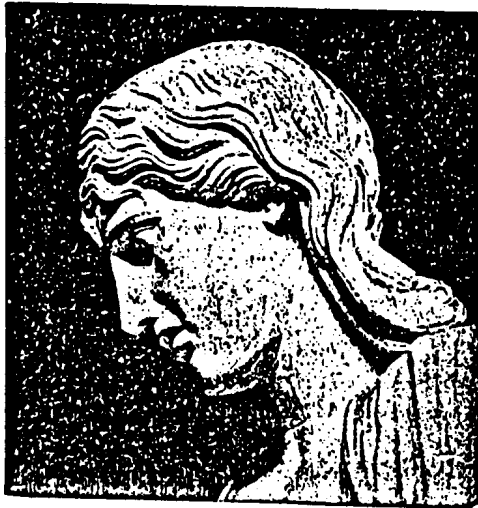
Abb. 2: Antike Porträtbüste eine Germanin (Thursneida?), jetzt in der Loggia dei Lanzi in Florenz. Die Büste zeigt, wie eine natürliche, sich der Kopf- und Gesichtsförm anschließende, wellige und lockige Haartracht Blondinnen am besten liebet. Bei Johannisur hat der Haarnoten im Nacken zu sitzen.