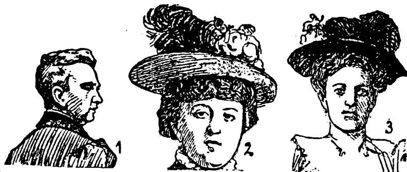
Abb. 1. Eine Gattenmörderin: männliche Gesichtsbildung, männlich auch in der Frisur und Kleidung. Abb. 2. Eine Raubmörderin: dunkler mongoloide Mischlingstypus, mongollischer Augenschnitt, kleine Schnauze, rundes Gesicht, höchst gefährlicher intelligenter erpresserischer Weibertypus. 3. Das Opfer der in Abb. 2 dargestellten Raubmörderin: eine langgesichtige Blondine, mit hellen Augen, langer, steiler, schmaler Nase. Man vergleiche diese Abbildung als wirksames Gegenstück zu den in Abb. 1, 2, 4-6 dargestellten Typen.

gleich wieder das Amt des Hurenweibels einführen und die Gebräuen mit mobilisieren.