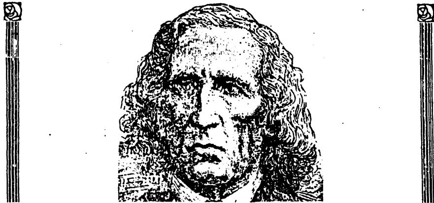
Die Freude unserer Jugend. Abb. 1: Jakob Grimm († 1863). Der Bahnbrecher der neuzeitlichen, leider unterbrochenen arlogermanischen Bewegung, der Mitbegründer der deutschen Kinder- und Hausmärchen, der Typus des Erziehers reinster, heroischer Rasse: Langgesicht, lange, schmale Nase, hohes Untergesicht, blondes gefoltes Haar, blaue Augen (in der Reproduktion leider verpaßt!). Alles was heute wirklich arisch und germanisch denkt, hat sich von Jakob Grimm direkt oder indirekt Bildung geholt.

schlechtsdrüsen vollständig ausgebildet sind. Die Kinder werden in den Dnanismus und die Perversitäten geradezu hineingestoßen. Daher kommen dann die Schülerselbstmorde, die Lehrermorde und überhaupt die von Jahr zu Jahr zunehmende Nervosität! frühzeitige Impotenz und raffinierte Bildungsgroßheit.