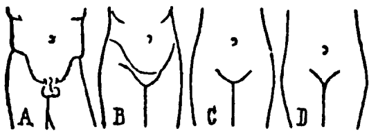
Abb. 4.: A. Beckenform des heroischen Mannes. Typisch die schöne Beckenfalte, relativ kleine Genitalien. B, C. Beckenform des heroischen Weibes. Typisch der einem sphärischen Dreieck ähnliche mons Veneris mit stumpfem Winkel gegen die Schamluge. D. Beckenform des Tschandaleweibes. Typisch der unentwickelte mons Veneris mit spitzem Winkel gegen die Schamluge.