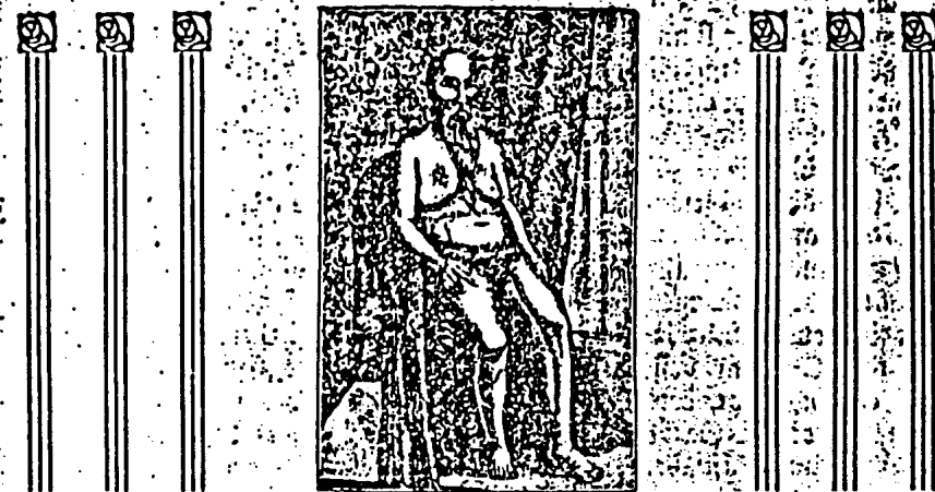
Abb. 1. Der moderne Hermaphrodit (Bottler) Maria Madeleine Lesort. Primäre Geschlechtsmerkmale und Brust weiblich, Gesicht mit dem starken Bartwuchs männlich.

Zuschriften, die beantwortet werden sollen, ist Rückporto beizulegen. Manuskripte höchstens abgelehnt! Besuche können nur nach vorheriger schriftlicher Anmeldung empfangen werden. Damenbesuche, wenn auch in Herrenbegleitung, grundsätzlich abgelehnt!