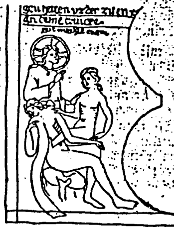
Abb. 3. Adam die Eva „gebärend“. Darstellung aus der Konstanzer Biblia pauperum als Beweis, daß auch noch im Mittelalter die Erinnerung an die hermaphroditische Grundnatur der Menschen lebendig war.