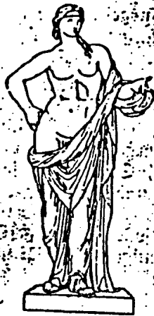
Abb. 2. Antiker Hermaphrodit (Bottler) aus der Sammlung Pompeii. Primäre Geschlechtsmerkmale männlich, Brust und Gesicht weiblich; gewöhnlich als androgynischer (männlichweiblicher) Apoll angesehen.

(Vgl. Dr. v. Römer: Die androgynische Idee des Lebens, Jahrbuch für sexuelle Zwischenstufen, V, Leipzig, 1908.)