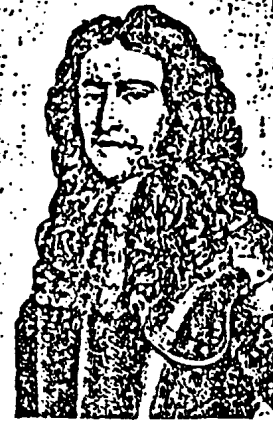
Abb. 4. König Wilhelm III. von England († 1702), nach einem Kupferstich von J. Houbraken. Seine weibliche Stige, Typus des sensiblen (passiven?) Umlings. Genialer Staatsmann, Gründer der englischen Weltmachstellung.