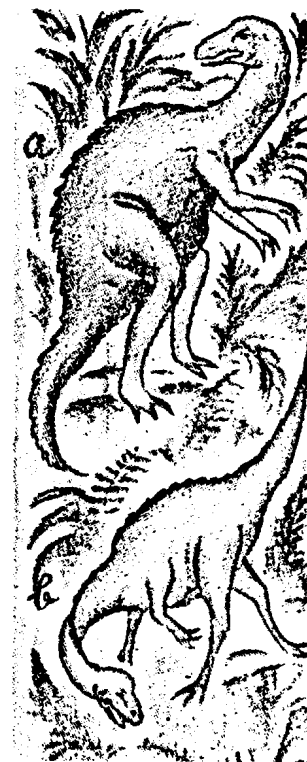
Zwei Dinosaurier-Arten, dargestellt auf dem Umschlag des Buches „Auf der Fährte des Urmenschen“ von R. Th. Andrews, Verlag Brockhaus, Leipzig. Beide Arten sind „Bipeden“ und besonders bei der Art b sieht man, daß diese Art ein Integrum von Bipes, Quadrupes und Vogel, oder die Stammform von Bipedem, Quadrupeden und Vogel darstellt. Diese Formen fand Andrews in der Mongolei tatsächlich belegt und es ist seine Ansicht (gleich mir), daß die Stammformen der Dominiden unter den bipeden Dinosauriern zu suchen seien. Die Bilder sind eine Bestätigung meiner 1904 erstmalig aufgestellten Thesen.