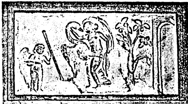
Antike Darstellung der Beichhaltung der Veda durch den „Schwamm“.