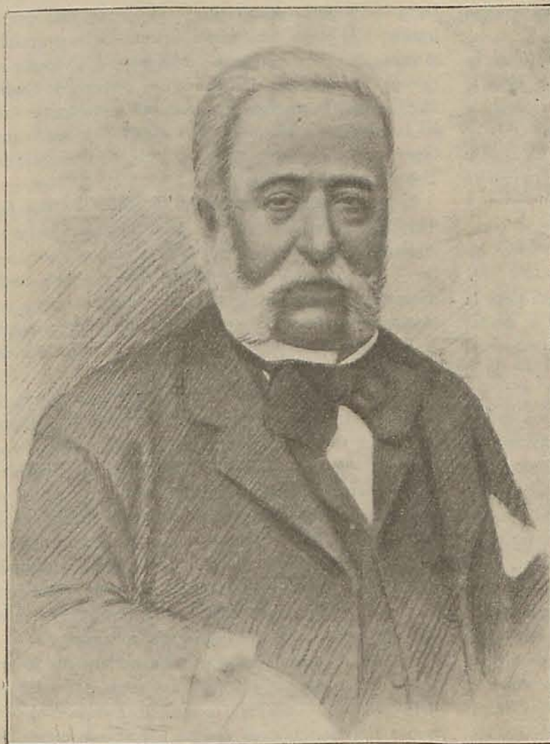
Ramón de Campoamor

..... ¿Me guío yo a mí mismo, o quién me guía? ¿Vengo a ser uno en dos, o dos en uno?