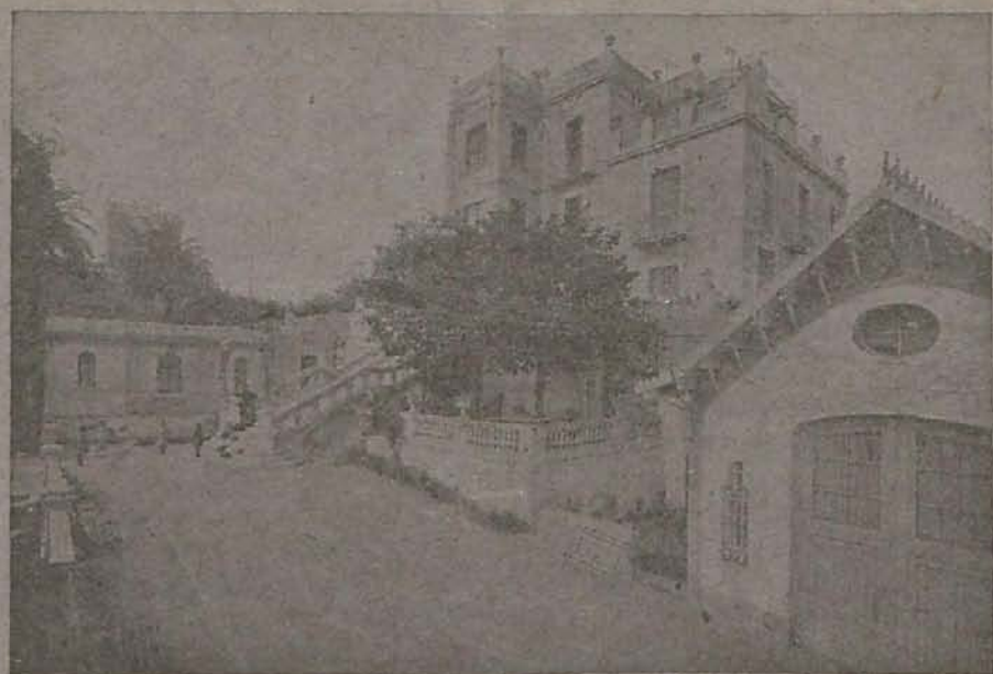
Vista parcial del Sanatorio de la Institución Ballbé