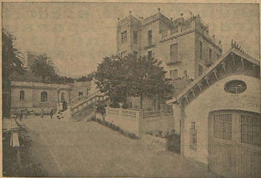
Vista parcial del Sanatorio de la Institución Ballbé