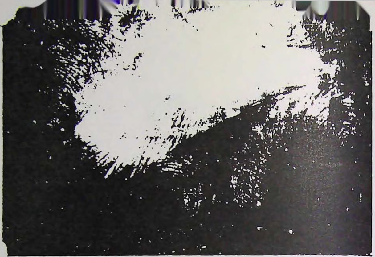
FIG. 5. — La colère.

Obtenu par le C r Darget, une plaque maintenue à un demi-pouce de son front à un moment où il venait d'éprouver une forte colère