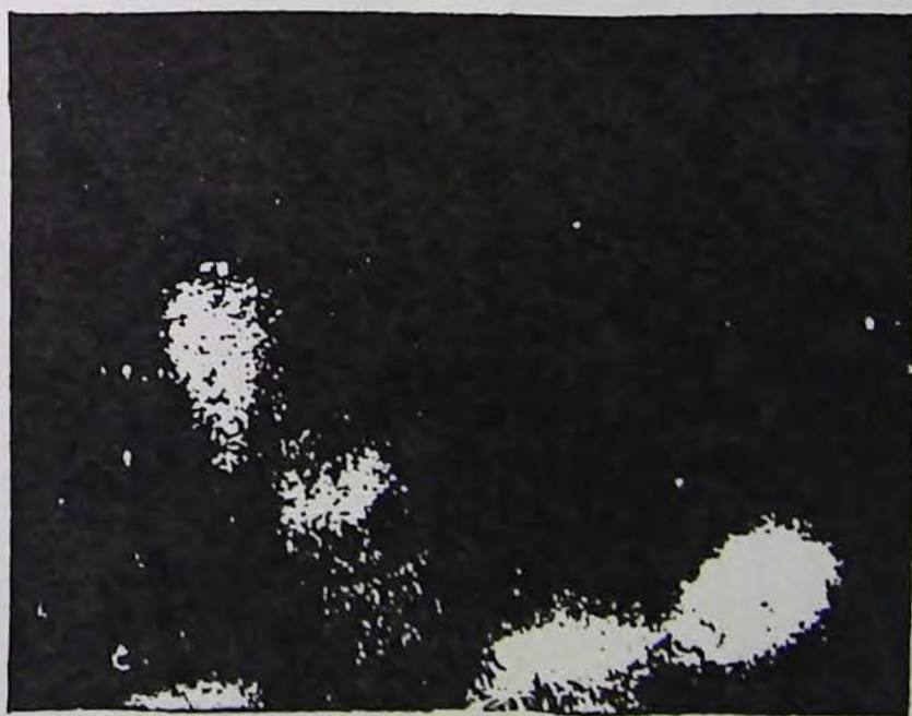
FIG. 2. — La deuxième Bouteille.

Forme mentale projetée par le C t Darget, après avoir longtemps regardé une bouteille.