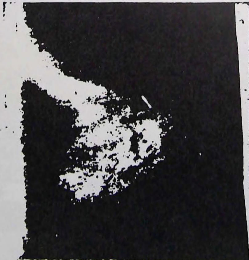
Fig. 4. - Règle.

Forme mentale que le C. Darget venait de regarder, projetée sur une plaque