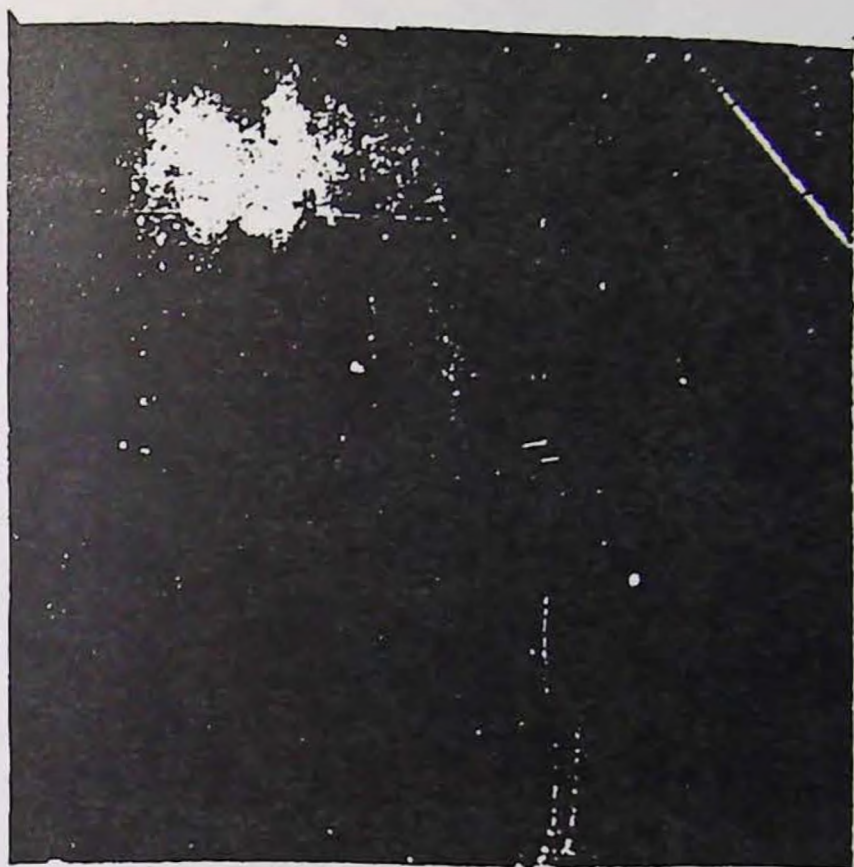
FIG. 1. — La première Bouteille.

Rayons X. Photo... de la Pensée La 1 re Bouteille