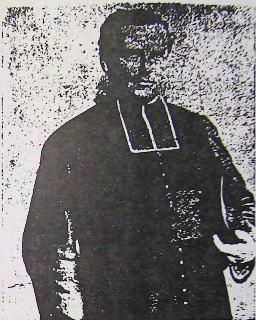
FIG. 7. — Double du Corps Astral du Prêtre.

Il ne peut y avoir double pose, puisque sa tête dépassant vers la droite, le corps ne dépasse pas, et que voyant le blanc du rabat on ne voit plus le blanc des boutons après la ceinture.