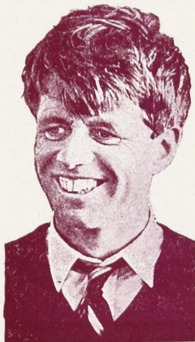
ΡΟΜΠΕΡΤ Φ. ΚΕΝΝΕΤΥ