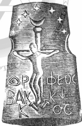
Ὁ σφραγιδολίθος τοῦ Μουσείου τοῦ Βερολίνου μετὰ τὸν Ὁρφέα Ἐσταυ- ρωμένον,

Ὁ συνδυασμὸς τῆς ἀρ- χαίας καὶ τῆς νέας λατρείας ἀρχίζει ἀπὸ τὰ παιδικὰ χρό- νια τοῦ ποιητοῦ. Σὲ ἡλικία 19 χρονῶν ὑπογράφει ἕνα ποίημά του μετὰ τὸ ψευδῶνυμο «Δημήτριος Διόνυσος», γιὸς τοῦ Διονύσου καὶ τῆς Δήμη- τρας. Γιά τὰ παιδικὰ του χρόνια, στὴν πατρίδα του Λευκάδα, ἔχει γράψει τὸν «Ὑμνο τοῦ μεγάλου νόστου», ὅπου ἀποκαλύπτει ὅτι οἱ ἀ- φέγγαρες νυχτιές, ὅταν πρω- τοδιάβαινε στ' ἀμπέλια, σιω- πηλὸς καὶ βυθίζοντας τὴ σκέ- ψη του στὸν ἑναστρο οὐρανό, τοῦ χάρισαν τὸν «κρυφὸ ἀρ- ραβῶνα τῆς μοίρας του», τοῦ σφράγισαν ὄλην τὴν μετέπει- τα πνευματικὴ του πορεία.