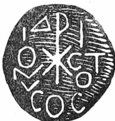
Σφραγίδα τοῦ Σικελιανοῦ στὸ «Ἀντίδορο»

Καὶ δὲ διστάζει, στοὺς δύο μεγαλυτέρους σταθμοὺς τῆς