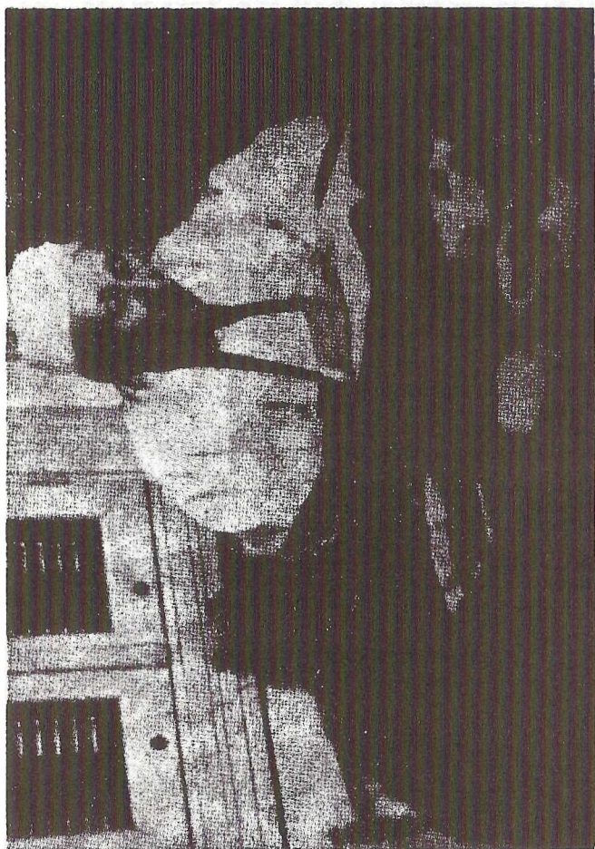
RENÉ GUÉNON au début de 1950.