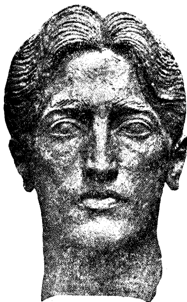
CABEZA DE J. KRISHNAMURTI