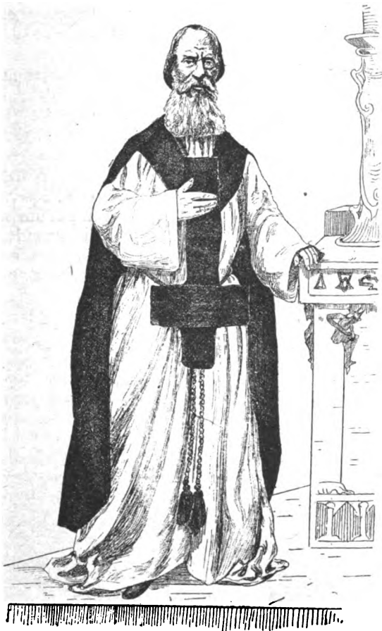
Un des rares portraits du fameux sorcier VINTRAS, l'inventeur de l'eau que nous vendons pour faire repousser les cheveux.