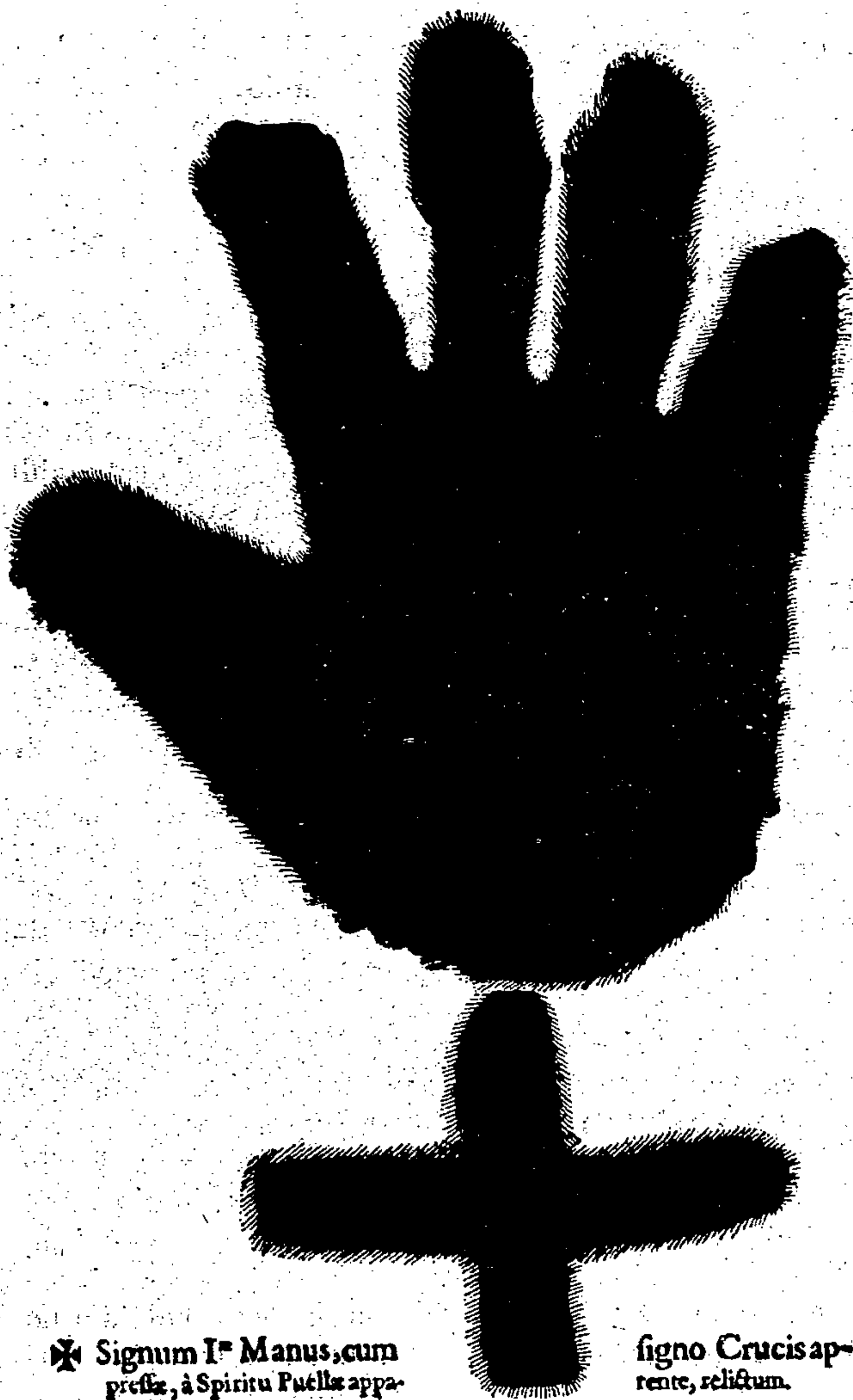
✠ Signum I m Manus, cum prelix, à Spiritu Puellæ appa-