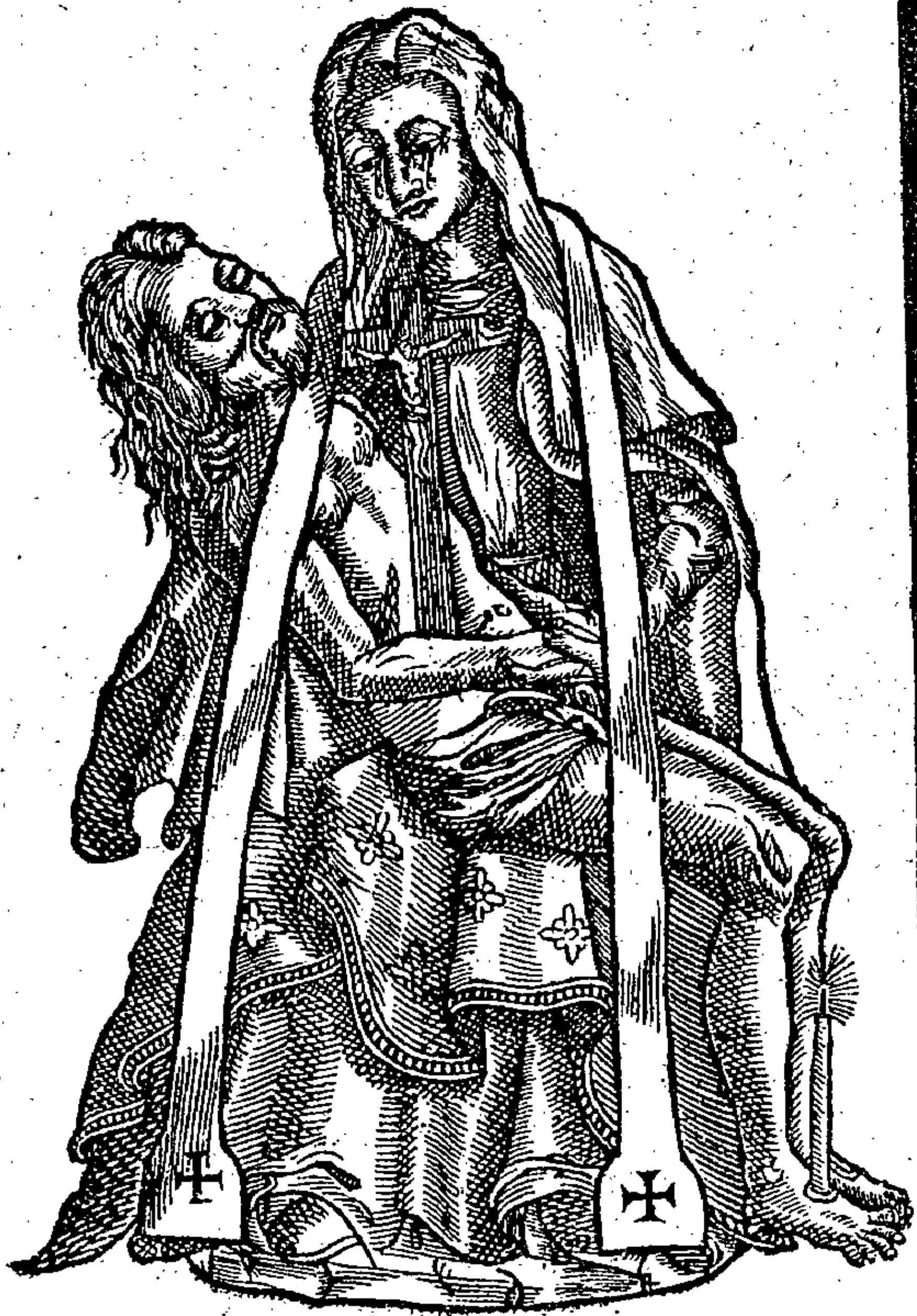
Signum 5 m est Statua, ab eodem Spiritu ut fiat petita, & postea ornata; ac tandem ad Templum solemniter delata.

Linea hæc lateralis oëties sumta, facit justam altitudinem hujus Imaginis B. M. V. Dolorosa.